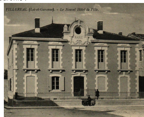
La mairie en 1912